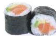
64. LAKS AVOCADO