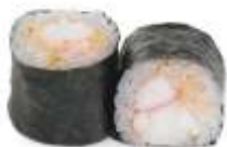
69. REJE CHILI