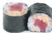
67. TUN CHILI