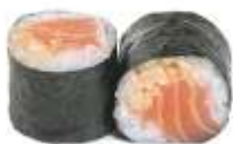
65. LAKS CHILI