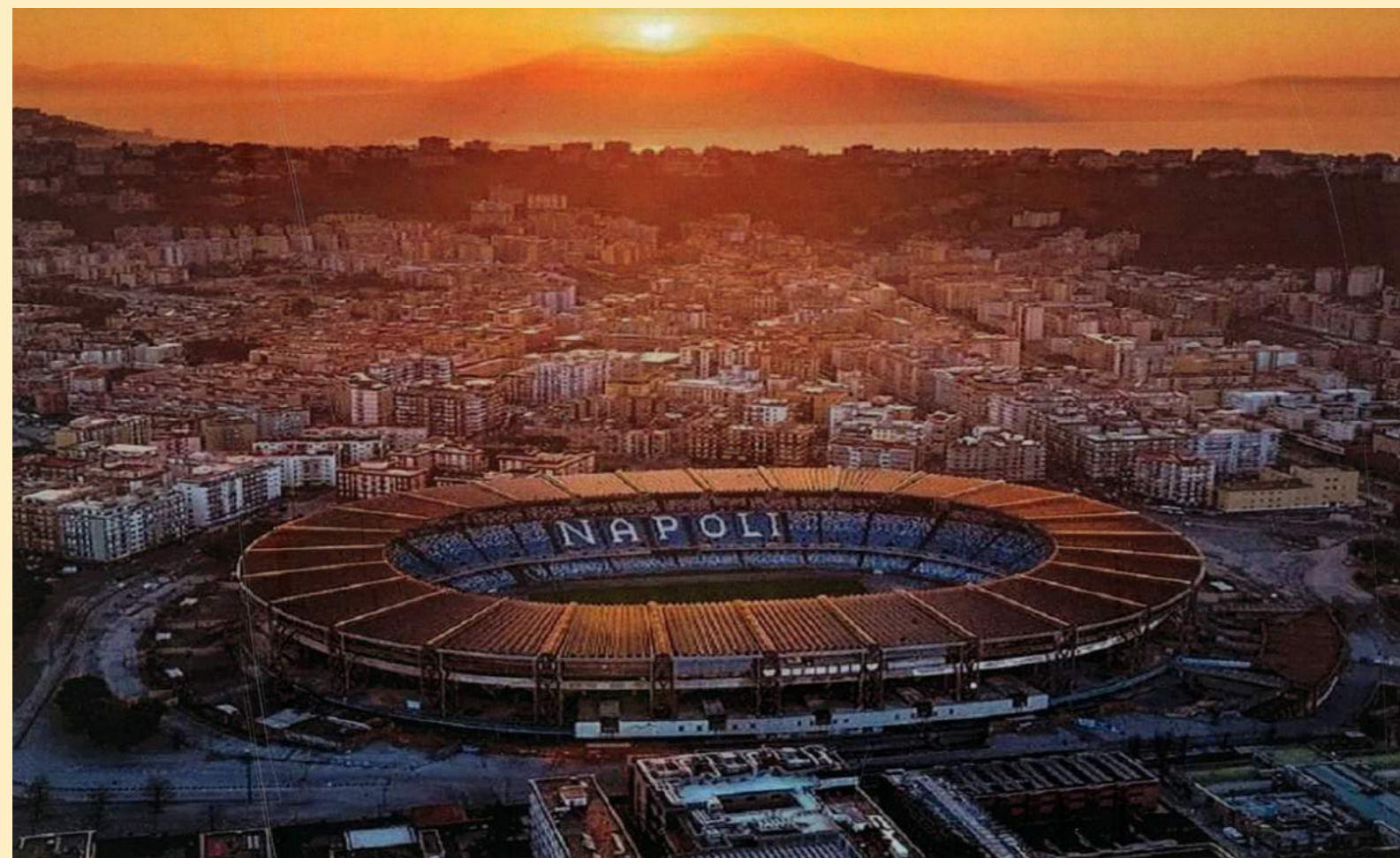
Stadio Diego Armando Maradona