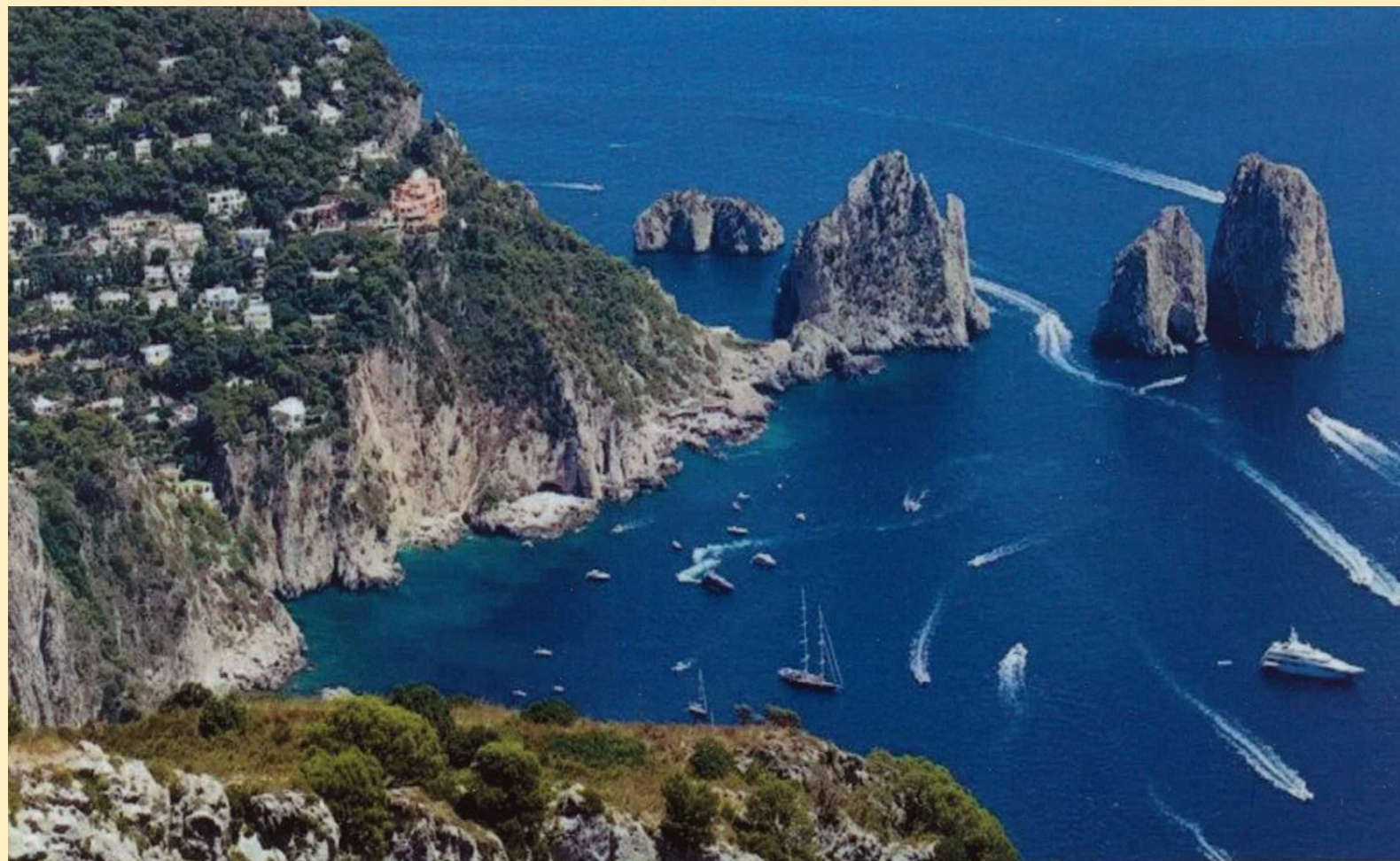
Isola di Capri