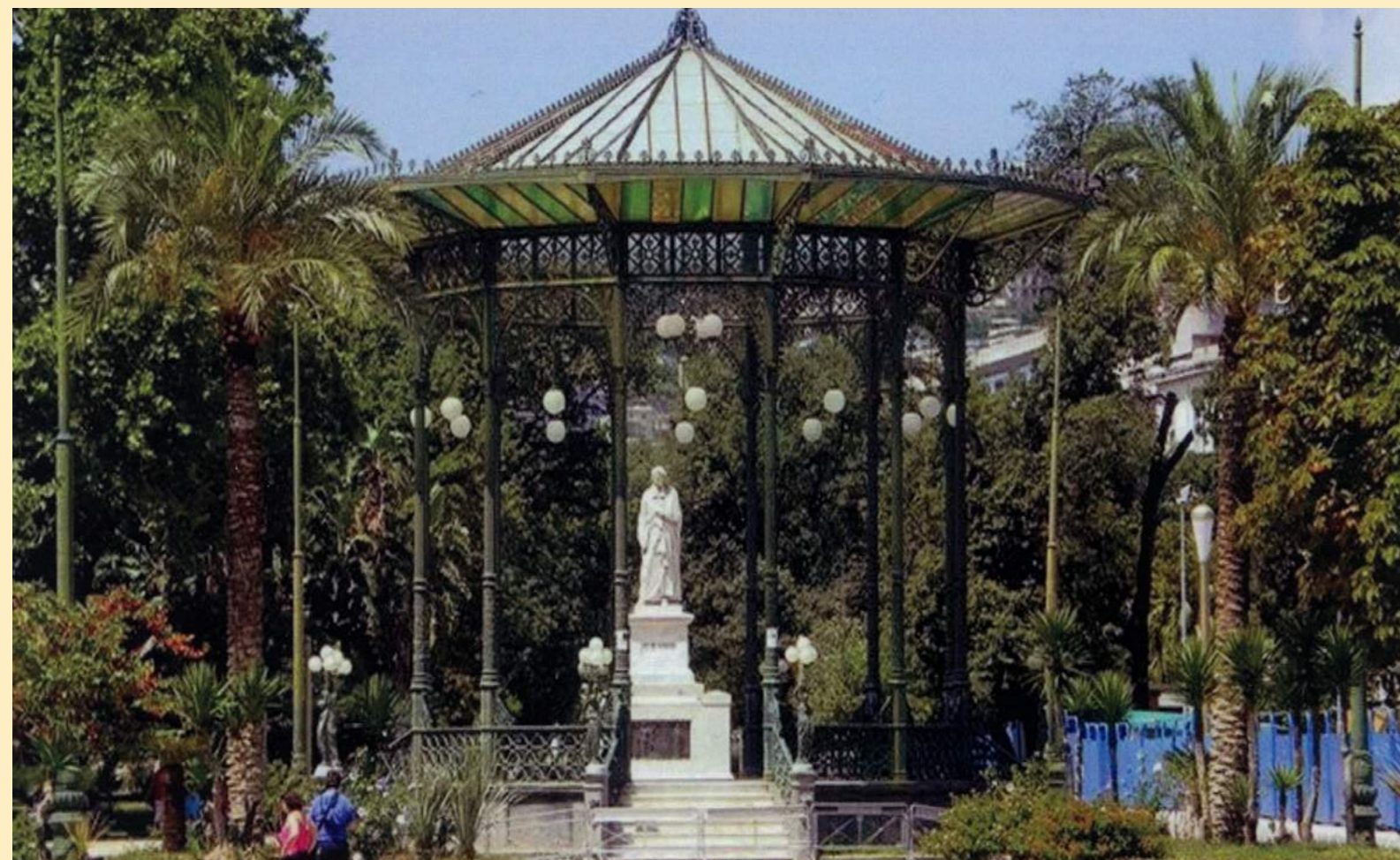
Villa Comunale di Napoli