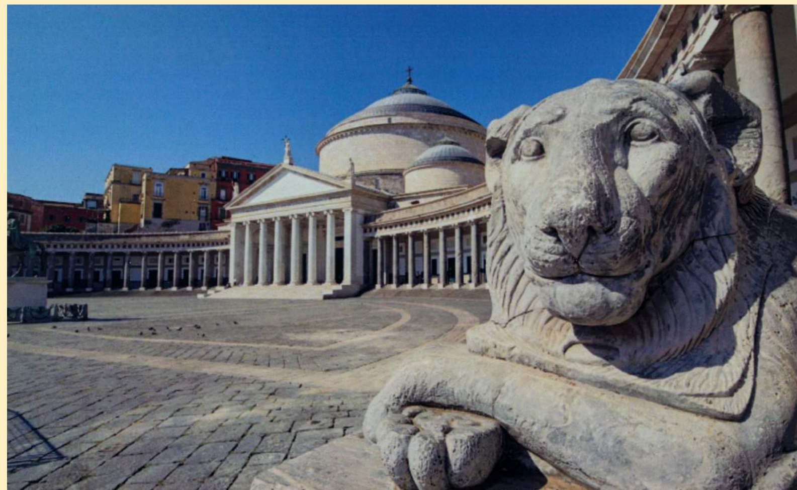
Piazza del Plebiscito